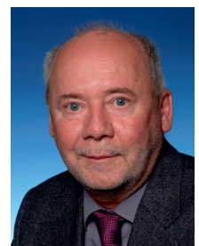
Vorsitzender 2004 - 2014