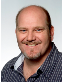
Vorsitzender seit 2014

Seit 2014 darf ich als Vorsitzender die Geschicke und die Zukunft mit meinen Vorstandsmitgliedern der Gewerbevereinigung Bobstadt lenken.